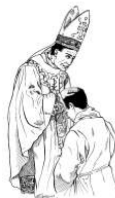
Figura n. 6 _____