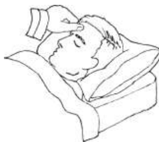
Figura n. 5 _____