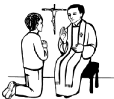
Figura n. 4 _____