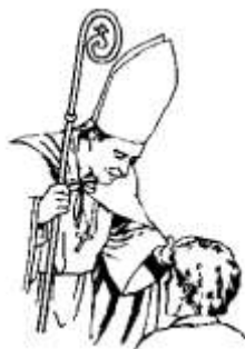
Figura n. 2 _____