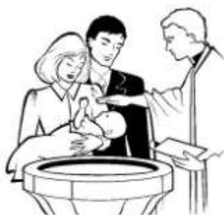
Figura n. 1 _____

1) Assegna ad ogni figura il nome del Sacramento a cui si riferisce.