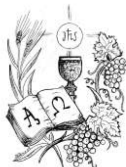
Figura n. 3 _____