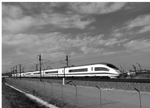
TRENO AD ALTA VELOCITÀ