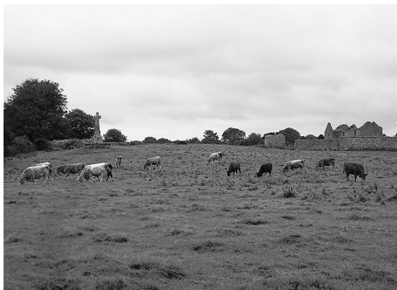
OVINI AL PASCOLO