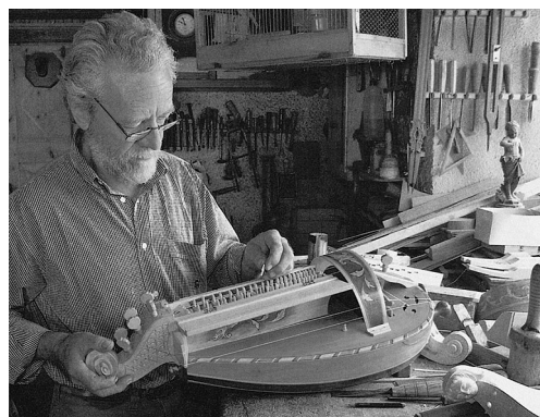
ARTIGIANO DEL LEGNO AL LAVORO