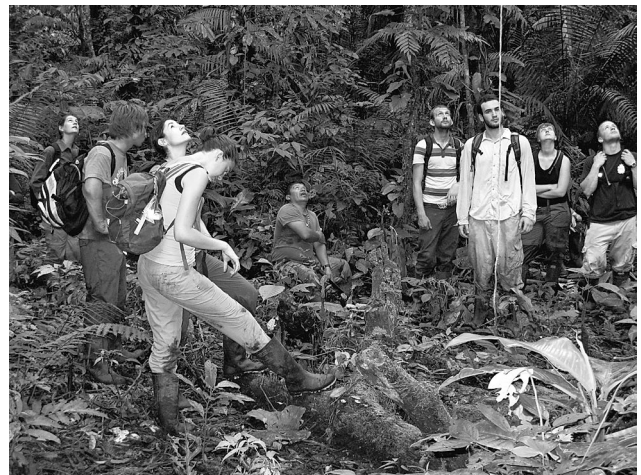
TURISTI IN UNA FORESTA TROPICALE