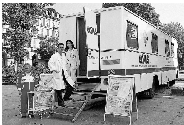
LA RACCOLTA DEL SANGUE