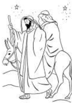
Figura n. 5