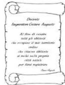
Figura n. 3