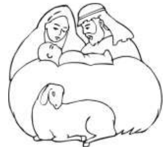
Figura n. 6

Inserisci nelle caselle sottostanti la sequenza esatta.