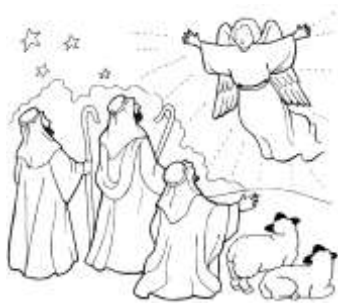
Figura n. 4