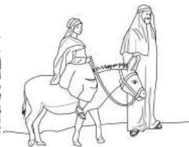
Figura n. 2