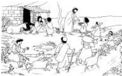
Figura n. 1

6) Metti in ordine le immagini che seguono, raffiguranti il racconto della nascita di Gesù.