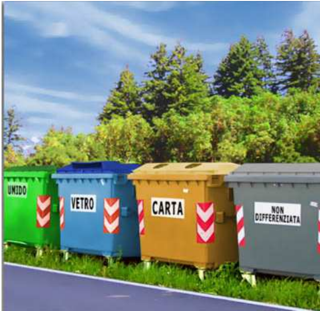
Si tratta di un tipo di raccolta che separa i rifiuti secondo il materiale da cui sono composti per poi riciclarli.

Il rifiuto è il punto di partenza per nuove vite: può essere infatti riutilizzato e poi riciclato. La raccolta differenziata va fatta ogni giorno: il primo passo è separare le cose che vogliamo buttare via a seconda del materiale di cui sono fatte: il vetro con il vetro, la carta con la carta. Dobbiamo usare dei contenitori diversi a seconda del materiale da smaltire. Bisogna separare anche quei rifiuti che possono essere dannosi, come le medicine scadute e le pile esaurite. I rifiuti vanno poi portati negli appositi contenitori che troviamo vicino alle nostre case.