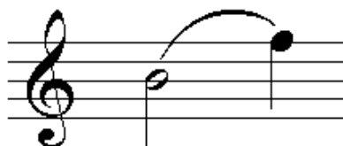
Legatura di portamento

La legatura che unisce due note di diversa altezza non è una legatura di valore. Questa legatura viene detta " di portamento " perché suggerisce all'esecutore un passaggio "portato" senza interruzioni di suono dalla prima alla seconda nota.