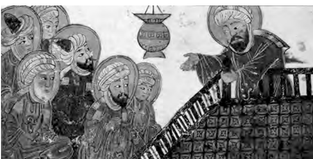
MAOMETTO PREDICA A UN GRUPPO DI FEDELI. MINIATURA ARABA DELLA BIBLIOTECA UNIVERSITARIA DI EDINBURGO.

GLI ARABI ACCETTARONO LA NUOVA FEDE E DIVVENNERO UN POPOLO UNITO .