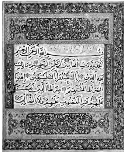
PAGINA DEL CORANO.

IL CORANO È IL LIBRO SACRO DEI MUSULMANI.