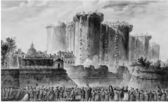
JEAN-PIERRE HOUEL, LA PRESA DELLA BASTIGLIA , 1789, OLIO SU TELA (PARIGI, MUSÉE CARNAVALET).